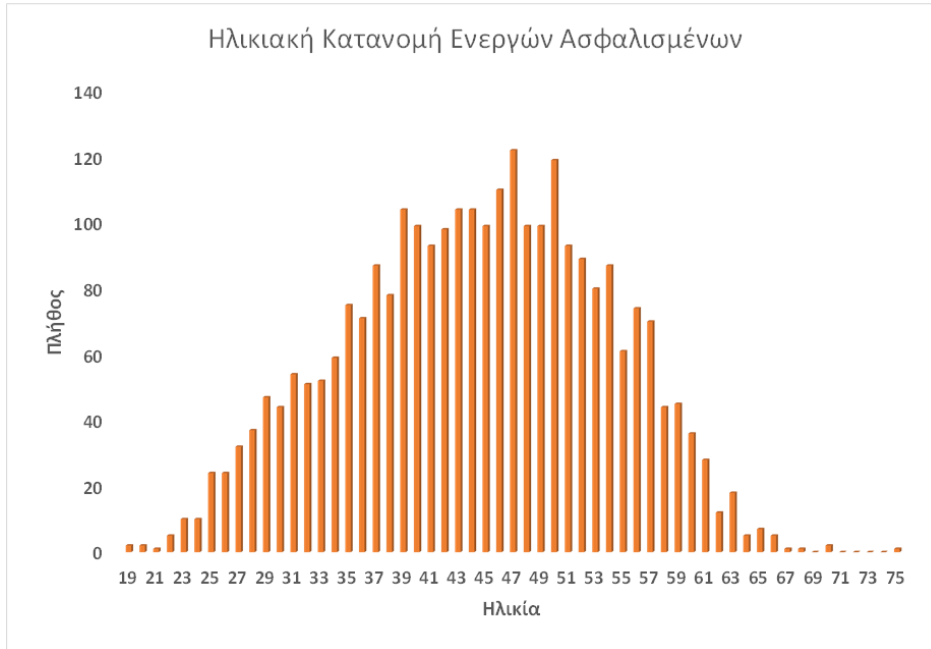
Διάγραμμα 1: Ηλικιακή Κατανομή Ενεργών Ασφαλισμένων

Η διαγραμματική απεικόνιση της ηλικιακής κατανομής των ενεργών ασφαλισμένων του ΕΤΕΑΠΕΠ, έχει ως ακολούθως: