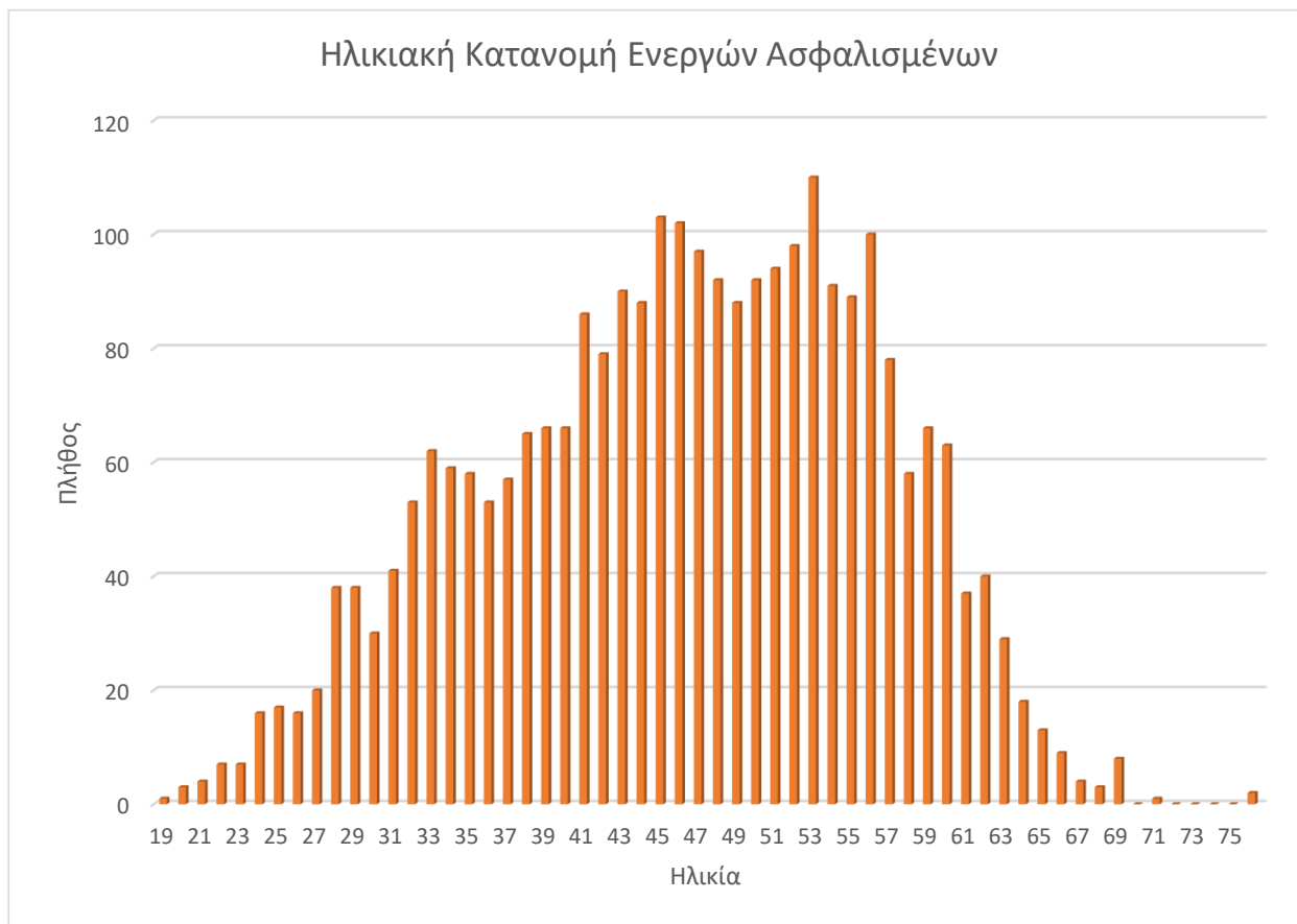
Διάγραμμα 2.1: Ηλικιακή Κατανομή Ενεργών Ασφαλισμένων